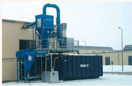
FOT. 2 Średniociśnieniowa instalacja do separacji pyłów pianki poliuretanowej – w wykonaniu przeciwwybuchowym

Instalacje wykonane przez firmę BART są zgodne z obecnymi, bardzo rygorystycznymi normami jakości i energooszczędności. Każde rozwiązanie ma charakter indywidualny, wychodzący naprzeciw oczekiwaniom klienta pod względem ergonomii, jak również pod względem technicznym.